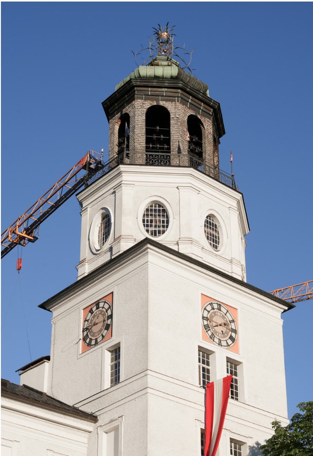
Täglich dreimal erfreut das Glockenspiel Einheimische wie Tourist*innen durch seine Melodien.