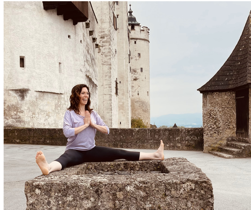
Die Yogamatte ausrollen und in einzigartiger Kulisse bewegt in den Tag starten.

Kosten: 25 Euro (inkl. Talfahrt mit der Festungsbahn; Aufstieg zu Fuß)