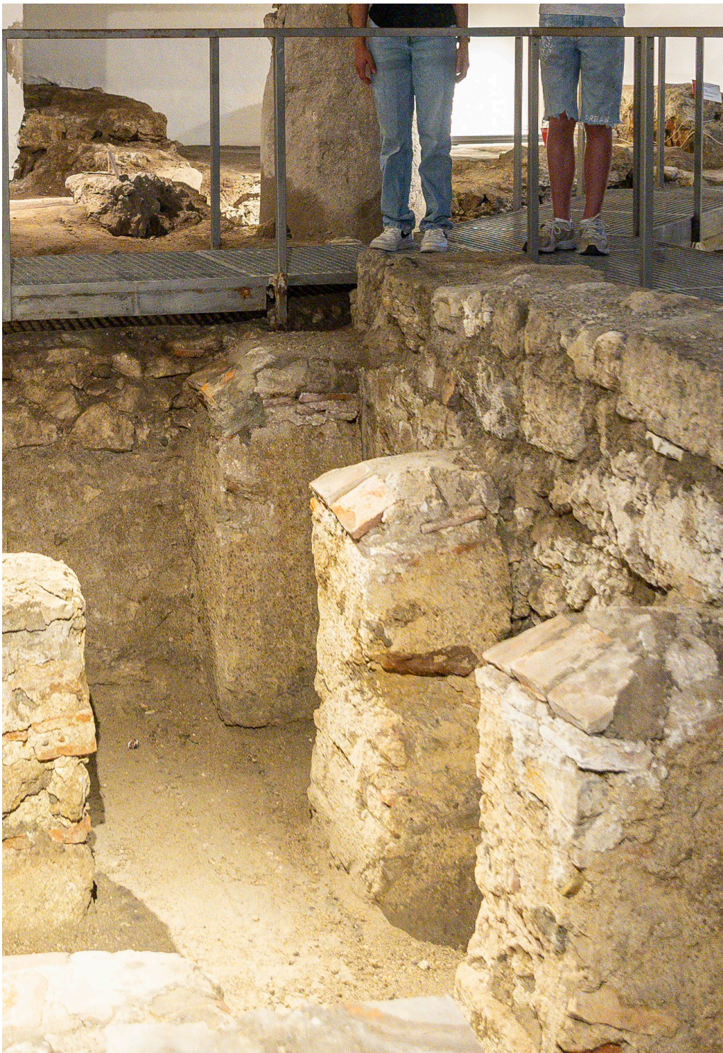
Hinab unter den Dom und hinein ins antike Salzburg.