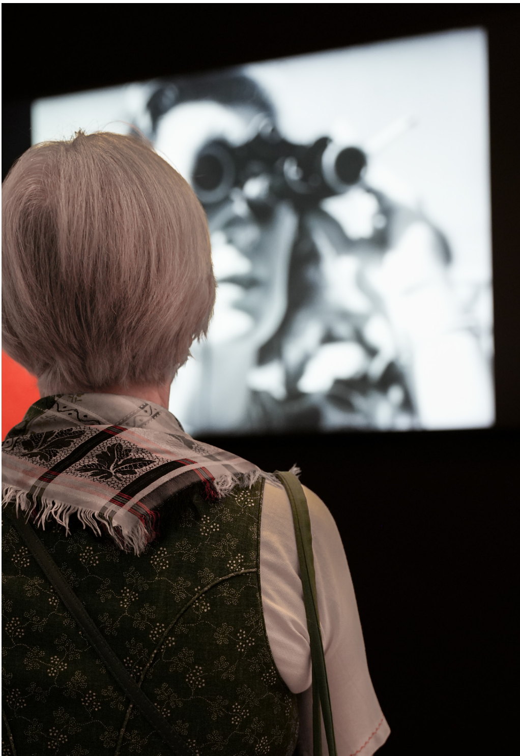
Edelweiß forever: Auf den Spuren von Familie Trapp, Tracht und Salzburgs touristischem Image