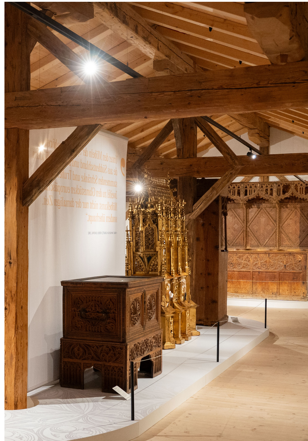
Bewundern Sie die kostbaren Meisterwerke aus gotischen Werkstätten bei der nächsten Exkursion.

renate.wonisch-langfelder@salzburgmuseum.at, +43 662 620808-709