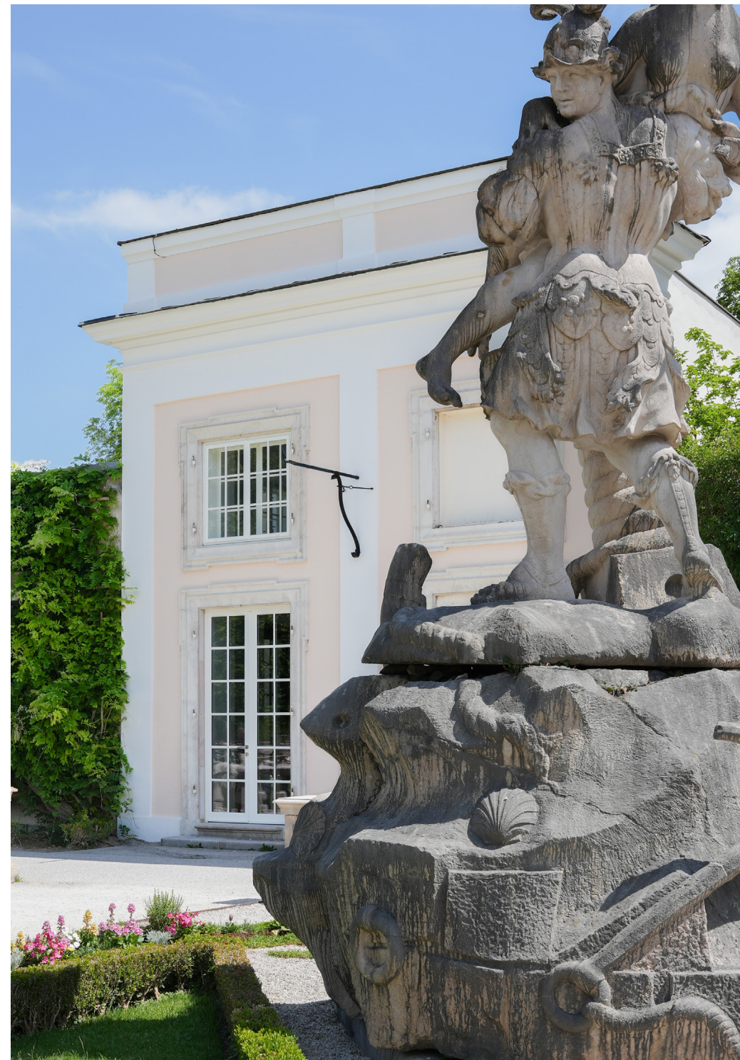
Die Orangerie Salzburg im malerischen Mirabellgarten und damit mitten im UNESCO-Welterbe Salzburg.

Orangerie Salzburg Mirabellplatz 3, 5020 Salzburg Montag bis Sonntag 9–17 Uhr www.orangeriesalzburg.at